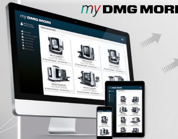
STROJE DMG MORI

KOMPLEXNÍ ŘEŠENÍ PRO DIGITALIZOVANÉ DÍLENSKÉ PROSTŘEDÍ