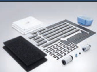
Obr.: Sada pro údržbu